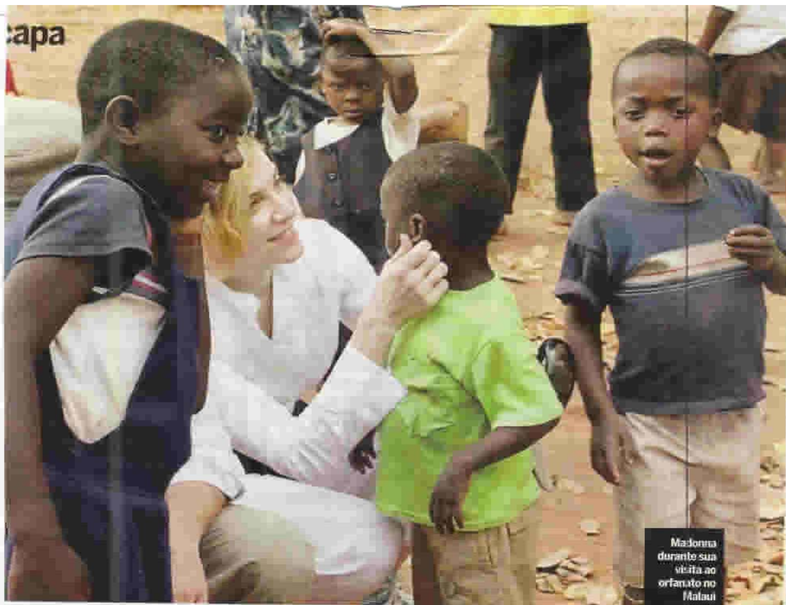
Madonna durante sua visita ao orfanato no Malawi