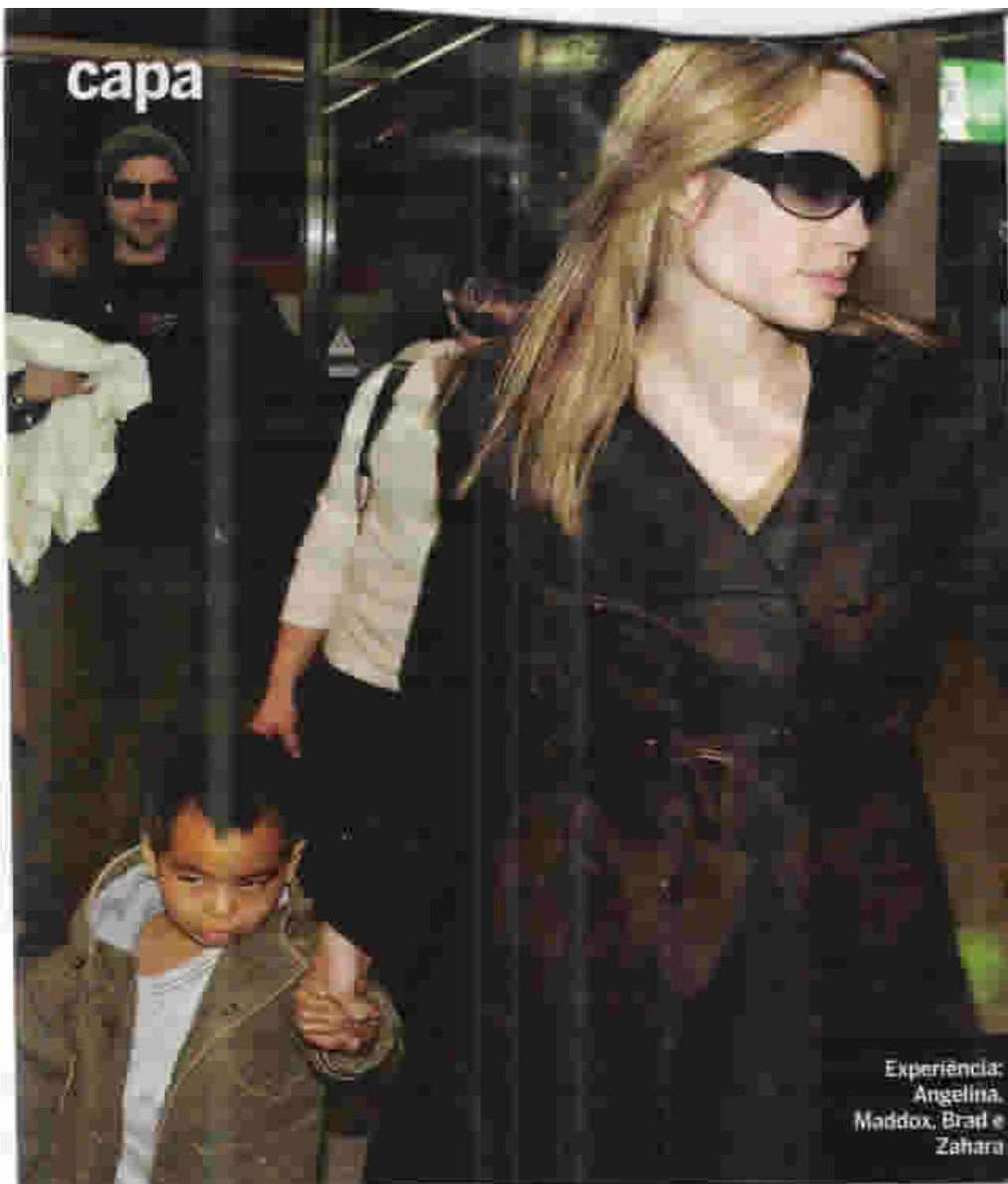
Experiência: Angelina, Maddox, Brad e Zahara