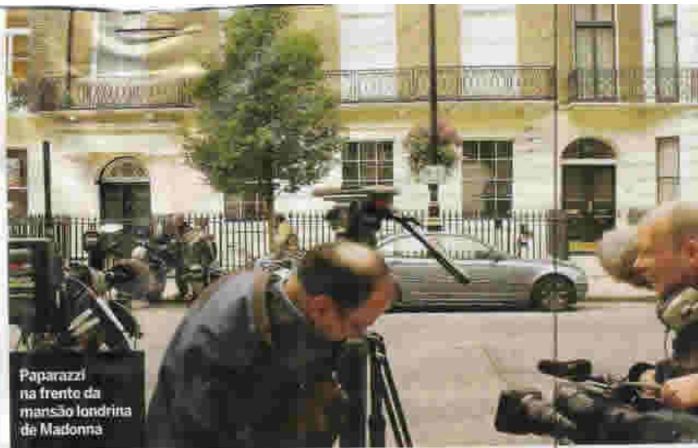
Paparazzi na frente da mansão londrina de Madonna